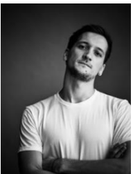
ジョフォア・ボブラヴスキー