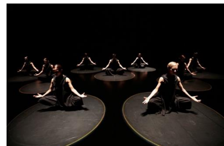
『Fratres I』（2019年）