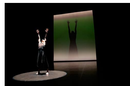
『Fratres II』（2019年）©Kishin Shinoyama