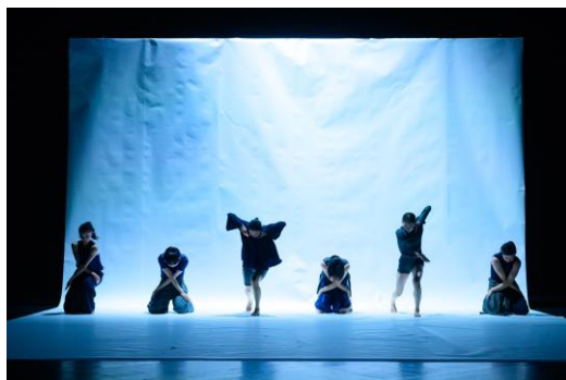
2025 年『とぎれとぎれに』より

22 年 9 月より Noism Company Niigata 地域活動部門芸術監督就任。