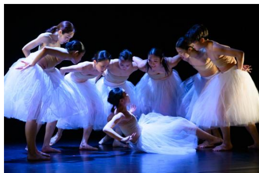
2025 年『It walks by night』より