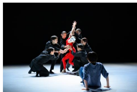
2022 年『火の鳥』より

Noism2 定期公演×振付家育成プロジェクト。 この新しい試みに、どうぞご期待ください。