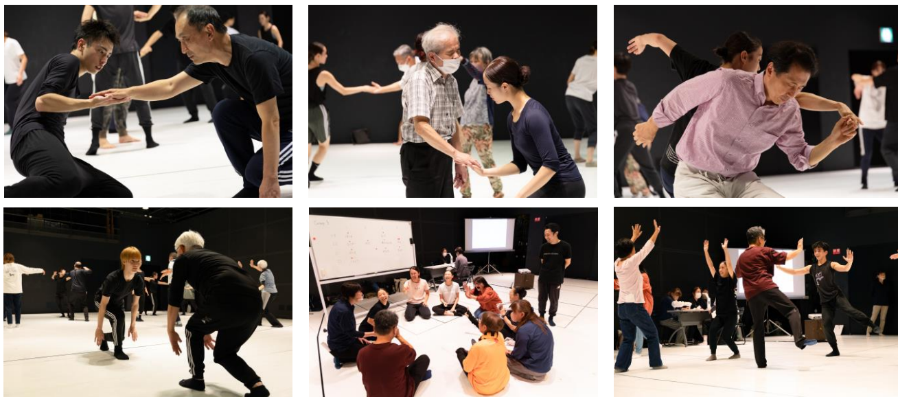
昨年のワークショップの様子

聴覚障がい者のためのからだワークショップ 2025年1月18日(土) 16:00-18:00