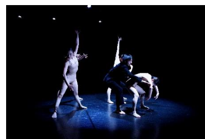
金森穰振付 Noism レパートリー（2020年定期公演より）

若き舞踊家達が、過去の Noism レパートリーと、今まさに彼らのために振り付けられる新作に全力で向き合い、自らの新しい可能性を見出すこと。Noism2 の定期公演ならではの挑戦と成長に今年もどうぞ注目ください。