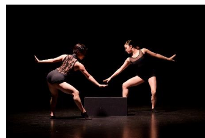
金森穰振付 Noism レパートリー（2019年定期公演より）