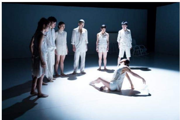
Noism2 春の定期公演 2014 より『Painted Desert』(演出振付: 山田勇氣)