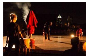
Noism2×永島流新潟博伝承会 『赤降る校庭 さらにもう一度 火の花 散れ』©Isamu Murai ※水と土の芸術祭 2015 参加作品

再演と新作、それぞれ異なる趣きを持ちながら「夢」というキーワードで結ばれた 2 作を通して、若き舞踊家と振付家が次なるステージへと歩みだす瞬間にご期待ください。