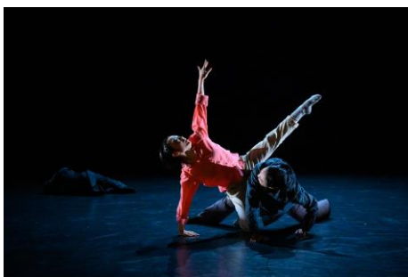
これまでの Noism2 定期公演より