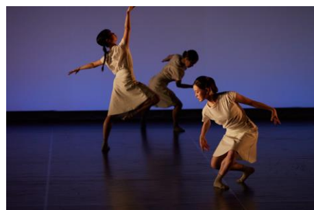
Noism1 メンバー振付公演 2022 より 撮影：松崎典樹